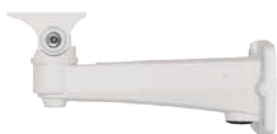
SN - BK346 soporte de pared